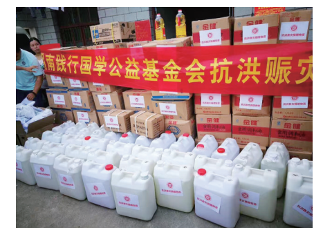
基金会募集的部分赈灾物资