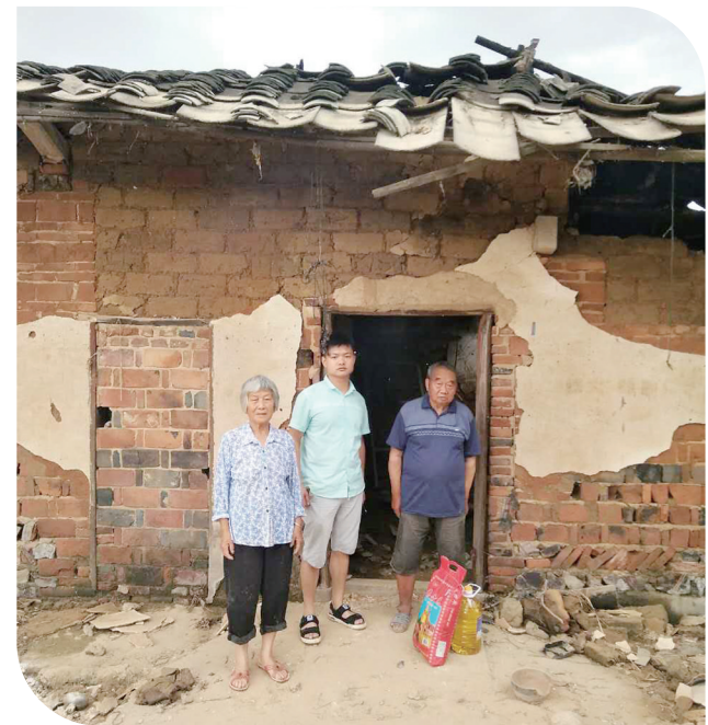
大米和食用油送到受灾群众家门口