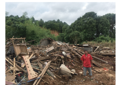
爱心人士给受灾群众带来了温暖和希望