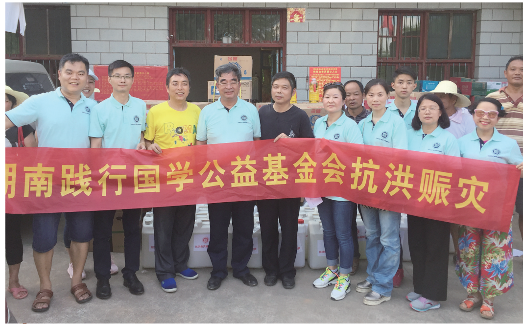
湖南践行国学公益基金会抗洪赈灾

本求末,把精力投入到报各种培训班来提高孩子分数的怪圈当中去。回想我们自己的成长教育历程,父母没有教我们知识,但他们的存在足以影响我们的生命状态。母亲柔弱、温和,她的爱像内衣,很贴心;父亲刚强、严格,像外衣,很规矩。这就是文化。他们“无为而为,不教而教”,对我们的影响是潜移默化的。这是一种状态的存在,不需要很多话,坐在那里就是教育。所以,国学班的师兄们在家庭中言传身教,实际上就是为孩子的性格养成教育树立典范。让孩子感应到你是温暖的,感应到这个世界上最温暖、最信任和爱着自己的时候,教育就发生了重要的作用。从这个意义上讲,家庭教育中循“道”而教,就是父母通过言传身教和心灵陪伴给孩子创造良好的文化场域和家庭氛围,使孩子在精神上得到滋养与成长。我想,这种循“道”而教的家庭教育模式也能够弥补当下学校基础教育阶段在人格教育上重视不足的缺陷,对教育转型期孩子的养成教育有一定的指导意义。