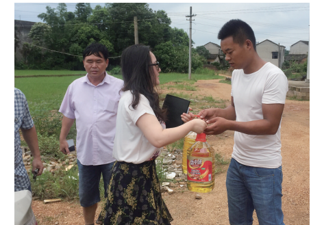
基金会工作人员传递爱心