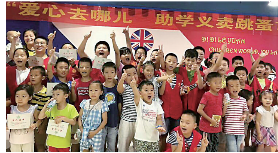
▲东郡读书会爱心助学活动