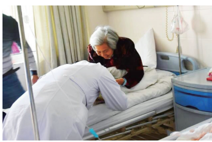
医院：人文病房暖意融

多年以来，“医术至上”思想风行医学界，医者只治患者身体之病而漠视其情感需求，医护人员也因工作过于负荷，物化为忙碌的机器，缺乏与患者的沟通、交流，医患纠纷愈演愈烈，甚至到水火不容的地步。新时代和谐融洽的医患关系路在何方？