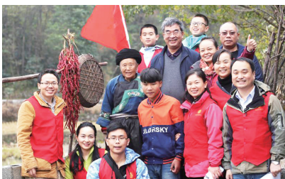
第六次走进花垣助学的奉献者团队（部分）

车队行驶在崎岖的山路上，山林中雾气弥漫，能见度约两百公尺左右。路旁稀疏的几处房舍，皆掩映在一片白茫茫的晨雾当中。也许是车队的喧嚣激起了山林里久违的热闹，偏僻破旧的老房子里偶尔伸出几个“小脑袋”，眼